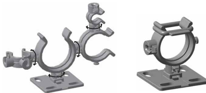
A Helawrap tartozék alkalmas több kábel vagy vezeték kötegelésére és védelmére.