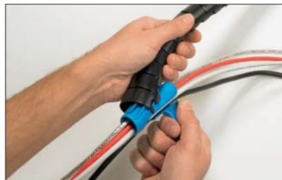
A szerszámot egyszerűen végighúzni a Helawrap védőcsőben.