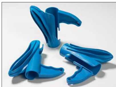
HAT behúzószerszám: 5 különböző méretben kapható.

Az új Helawrap szerelő szerszám lehetővé teszi a kábelek gyors és erőfeszítés nélküli kötegelését. A szerelő szerszám használata optimalizált, könnyen rácsúszik a spirál, így a kábel könnyedén a Helawrapra illeszthető. Az egyedi kialakítás folytán a kábelek a szerszámról egyenként is eltávolíthatóak, és a szerszám nyílásán keresztül elágaztathatóak. A szerszám minden Helawrap csomagban megtalálható. Egyéb eszközök külön is megvásárolhatóak.