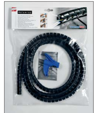
Helawrap, a biztos megoldás a kábelek rendezésére.