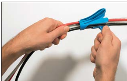
A vezetékét oldalról a behúzószerszámba kell helyezni.