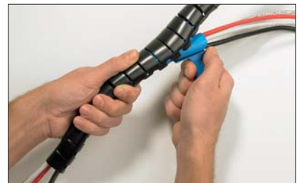
A szerszámot egyszerűen végighúzni a Helawrap védőcsőben.