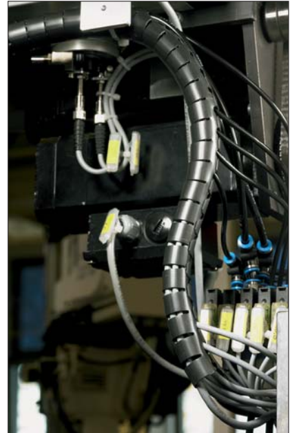
Teljes hosszában flexibilis - kábelkivezetés bármely részén lehetséges.

A Helawrap HWPAV0 spirálcső kábelek és vezetékek külső védelmére szolgál, különösen olyan helyeken, ahol vibráció és mozgás van. Az égésgátló adaléknak köszönhetően a Helawrap HWPAV0 olyan területeken is használható, ahol a tűzvédelem lényeges szempont. A Helawrap HWPAV0 különösen alkalmas a vasúti járműiparban, ahol a szigorú NF F 16-101 és 16-102 előírásnak teljes mértékben megfelel.