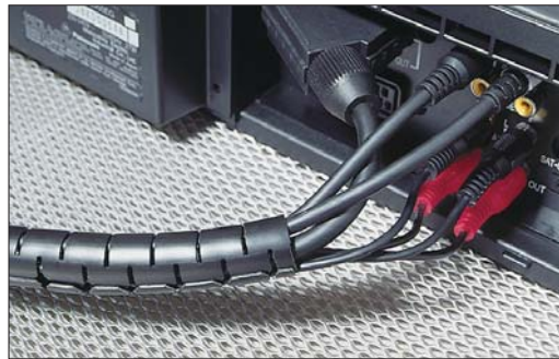
Helawrap védőcsövek és rögzítő elemek irodai és otthoni felhasználáshoz.

A praktikus 2 méter hosszú Helawrap HWPP ideális megoldás otthonra vagy az irodába, számítógép, televízió vagy Hi-Fi-rendszer kábeljeihez.