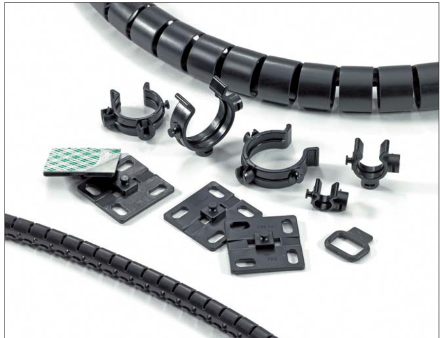
A Helawrap tartozék alkalmas több kábel vagy vezeték kötegelésére és védelmére.

Ugyanakkor ideálisak otthoni és irodai használatra is.