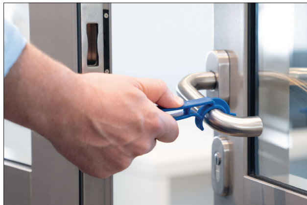
EasyDoor™ - bezdotykový otevírač dveří.