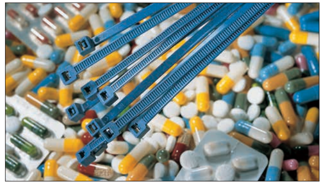
Sicherer und sauberer Produktionsprozess mit Kabelbindern der MCT-Serie.