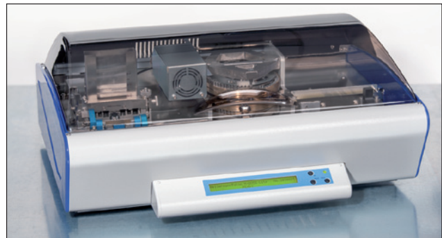
Platzsparend und einfach zu bedienen: Das Edelstahlprägesystem M-BOSS Lite.