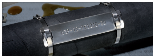
Kennzeichnung für extreme Umweltbedingungen: M-BOSS Lite Edelstahlmarkierer.