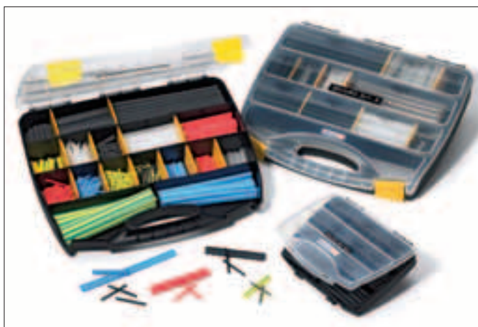
Stort udvalg af krympeslange i forskellige størrelser, farver og længder.

ShrinkKit 321 æsker findes i 3 forskellige udførsler. ShrinkKit 321 Universal, ShrinkKit 321 Basic og ShrinkKit 321-A. Med det høje krympeforhold på 3:1 kan disse produkter erstatte flere forskellige størrelser krympeslanger og derigennem benyttes til stort set alle arbejdsopgaver. Det er let at vælge det rigtige produkt, eftersom krympeslangerne er tydelig mærket i hvert rum med størrelse, længde og antal.