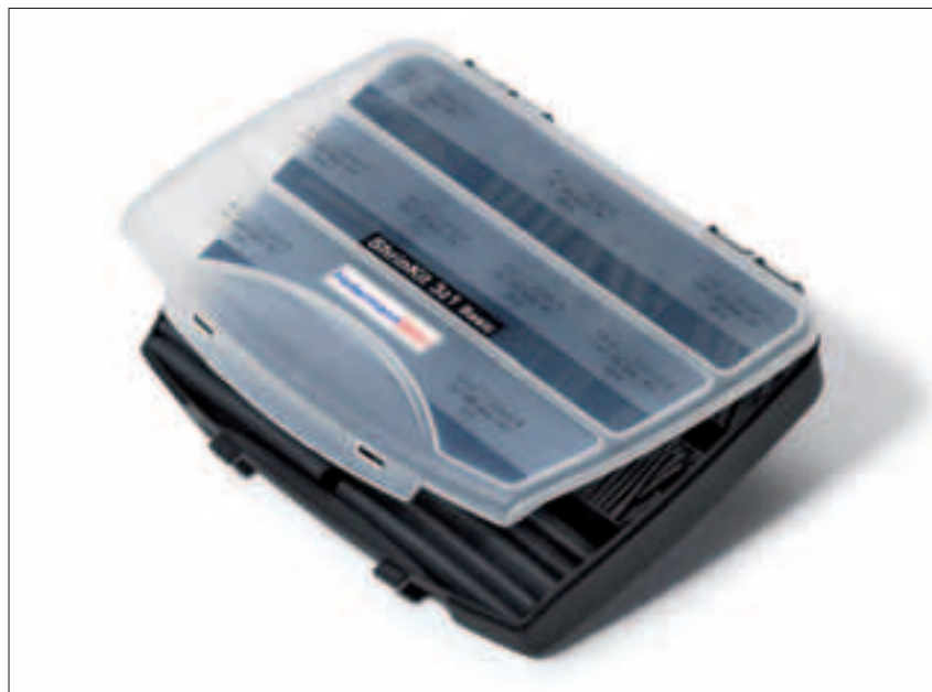
ShrinKit 321 Basic.

Denne æske indeholder et stort udvalg af sorte krympeslanger i 5 forskellige størrelser og længder.