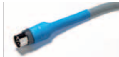
Krympeforholdet 3:1 dækker et bredt arbejdsområde.

Denne æske indeholder et stort udvalg af krympeslange i forskellige størrelser, farver og længder. Med 272 afklippede længder foretrækkes denne æske af professionelle brugere. Æsken genfyldes ved at bestille refillpakker der indeholder komplette sæt.