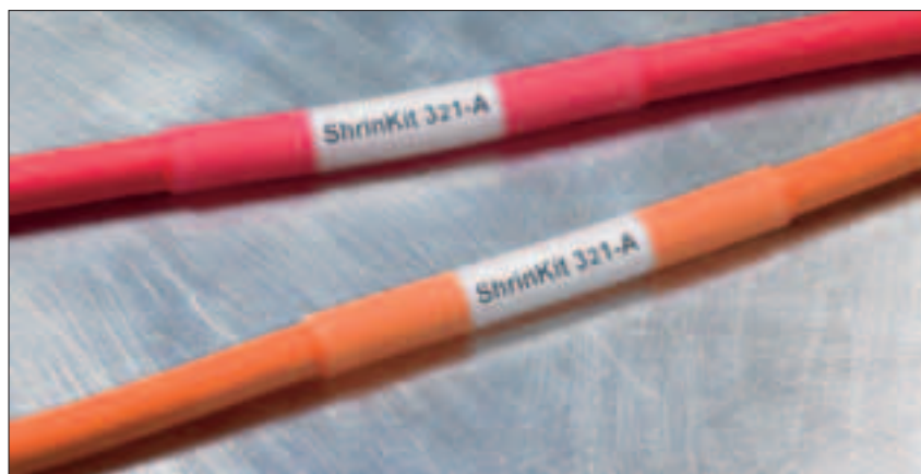
ShrinKit 321-A: Permanent beskyttelse af mærkning.

Denne æske indeholder et stort udvalg af krympeslange i 4 forskellige længder i farverne sort og transparent.