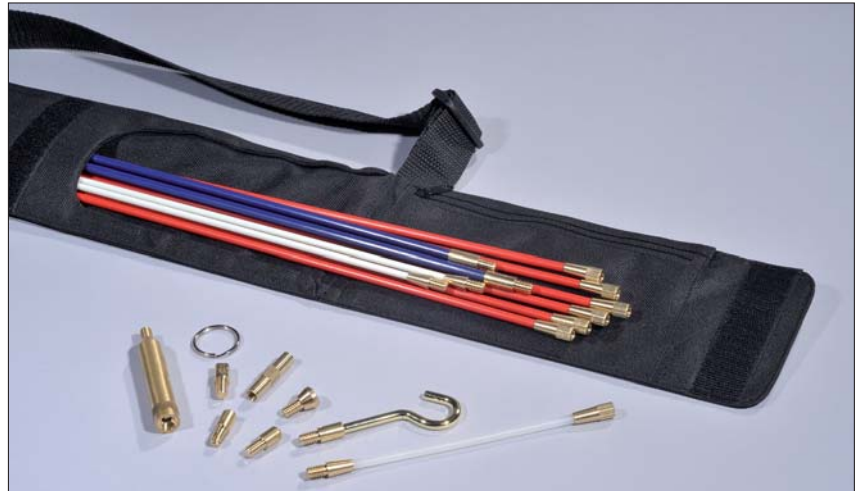
I Cable Scout+ Deluxe set opbevares alle stænger samt tilbehør opbevares pænt og nydeligt.

Cable Scout+ er værktøjet til den professionelle, som gør det muligt at udføre kabelinstallationen hurtigt og effektivt. Stængerne er fremstillet af glasfiberforstærket plast og kan trække en kabelvægt på op til 80 kg.