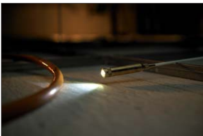
LED-lampe - det perfekte hjælpemiddel til at orientere sig i hulrum.

Med det brede tilbehørsprogram samt stænger med forskellig fleksibilitet, kan Cable Scout+ anvendes i mange forskellige applikationer.