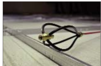
Viften glider over ru og ujævne overflader.