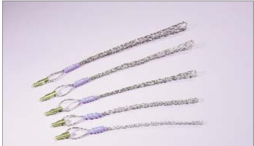
Trækstrømper er tilgængelig i fire forskellige størrelser.

Trækstrømpen er designet til at gribe fast om kablets yderside og fastholde det.