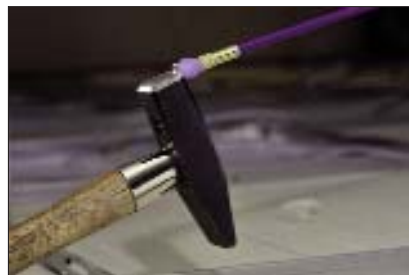
Den stærke magnet kan lyfte et værktøj på op til 2,5 kg.