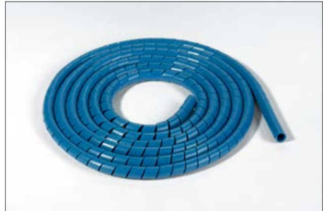
SBPEMC metalholdig Spiralslange.