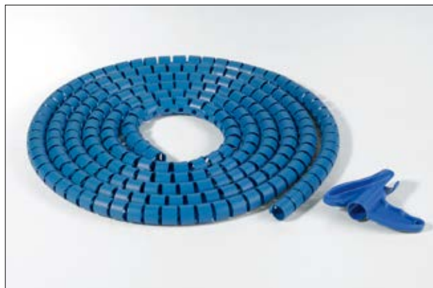
HWPPMC metalholdig kabelslange.