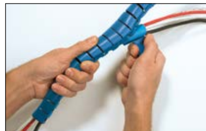
Træk applikatoren gennem Helawrap slangen.