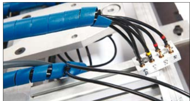
Sporbar metalholdig spiralslange der beskytter kabler og ledninger i fødevarer procesudstyr.