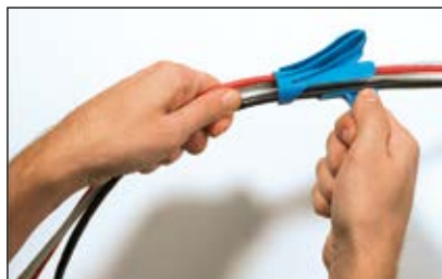
Ledningerne placeres i applikatorens åbning.