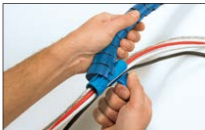
Placer applikatoren i den ene ende af Helawrap slangen.