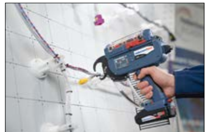
Forsynet af mobilt batteri og med kabelbindere