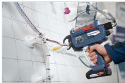
Forsynet af mobilt batteri med kabelbindere fra overhead suspension