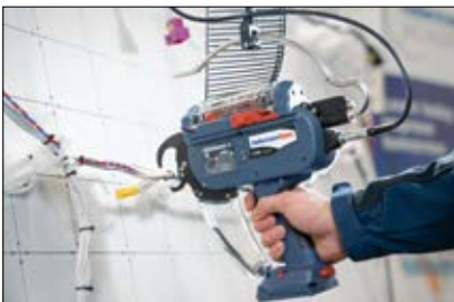
Forsynet via strømforsyning