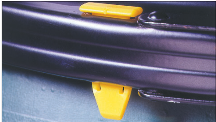
Fassplombe DLS01 zur Sicherung eines Fasses am Spannring

Die Fassplombe DLS01 ist eine neutrale Plombe, die beim Eindrücken des Plombenkeils in einem Spannring arretiert. Bei Manipulation bricht der Keil und gibt die Verriegelung frei. Diese Plomben können nicht bedruckt werden. Fassplomben werden ausschließlich zum Versiegeln von Spannverschlüssen an Fässern aller Art eingesetzt.