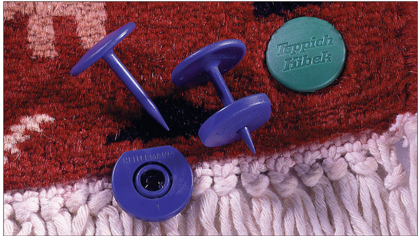
Stiftplomben STIFT, AUFNAHME

Diese zweiteilige Plombe besteht aus einem STIFT und einer AUFNAHME. In der Aufnahme ist ein Metallring zur Sicherung integriert. Die Plomben werden zum manipulatorsicheren Schutz von Teppichen oder ähnlichen Objekten verwendet. Zur Kennzeichnung auch mit Formeinsatz möglich.