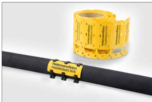
TAGDR - Placa de Identificación con resistencia a Diesel.