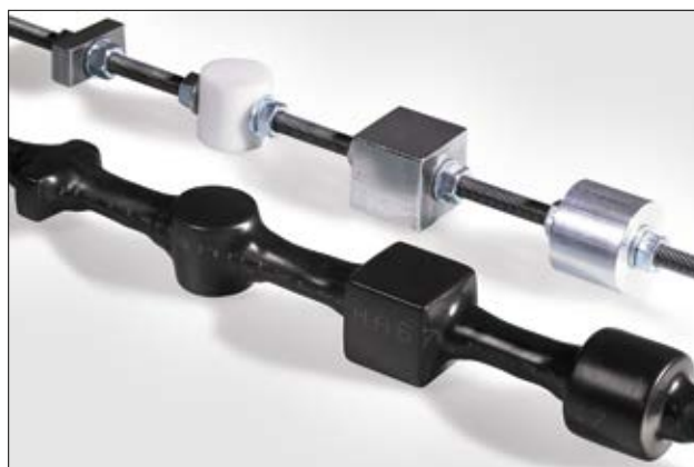
Gaine thermorétractable HA67 - Particulièrement indiquée pour les formes et dimensions complexes.