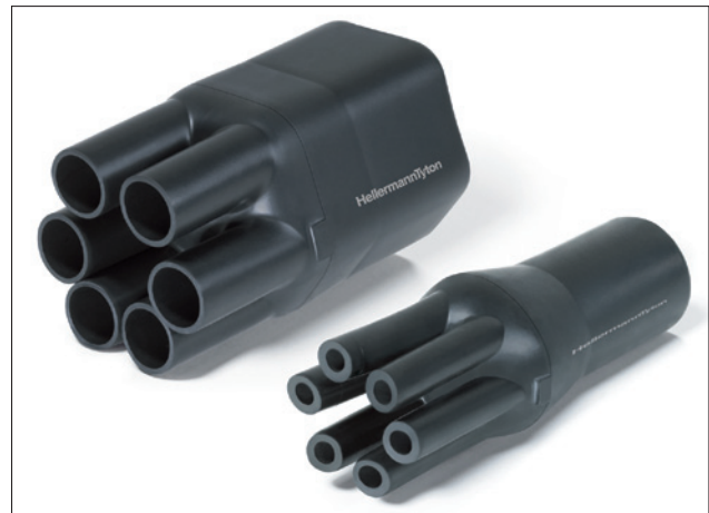
600 Serien före / efter krympning.