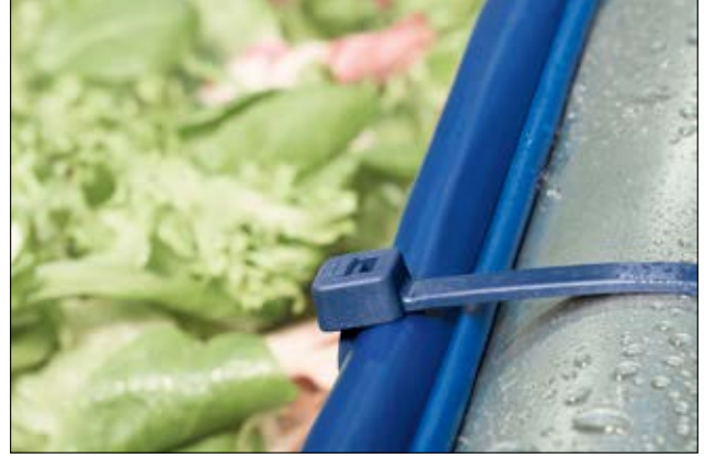
Algılanabilir MCT(S) kablo bağlarımız gıda ve ilaç endüstrisinde kullanılmaktadır.

Malzeme özellikleri sayfasına bakınız 24.