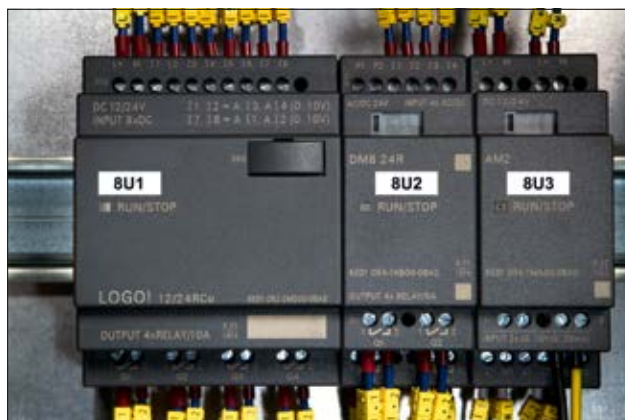
La fácil identificación de etiquetas asegura una rápida instalación y gestión de cableado.