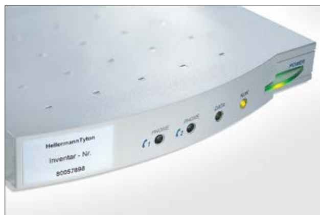
Etiqueta Helatag para identificación permanente de equipos.