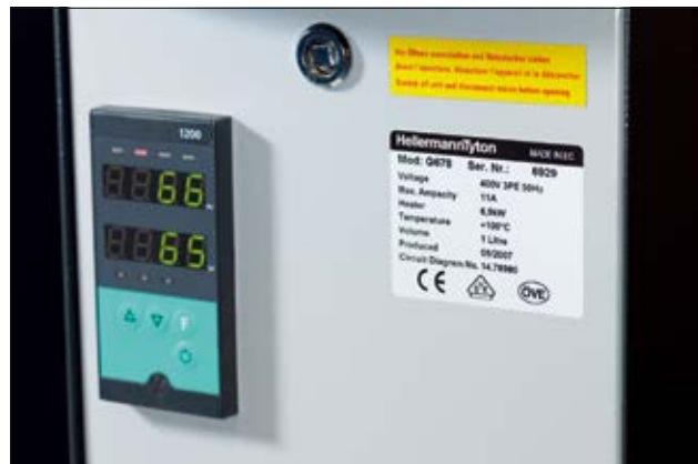
Identificación profesional en una unidad de calor.