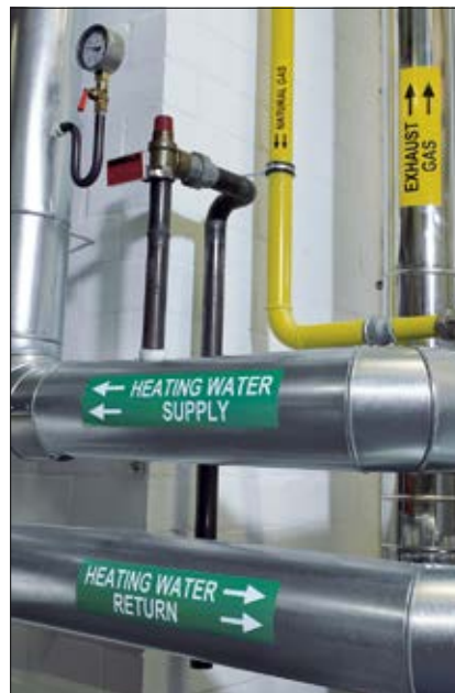
Marcaje de alta visibilidad para tuberías de gran longitud.