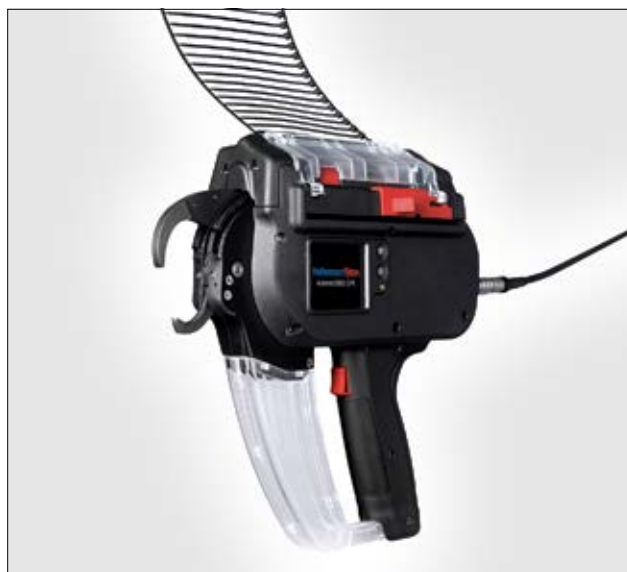
Autotool 2000 CPK.