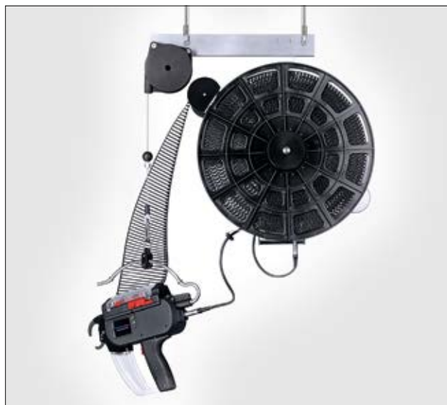
Oppheng CPK, Autotool 2000 CPK, Power Pack CPK og T18RA3500.