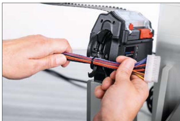
Applikasjon med benkmonteringskit CPK.