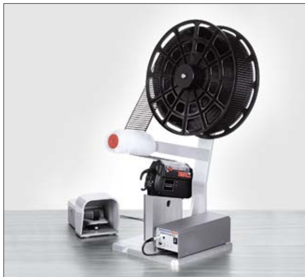
Benkmonteringskit CPK med fotpedal, Autotool 2000 CPK, Power Pack CPK og T18RA3500.