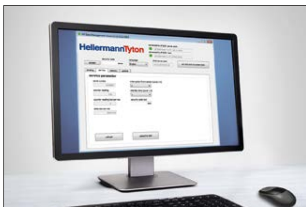
Autotool 2000 CPK Service Software.