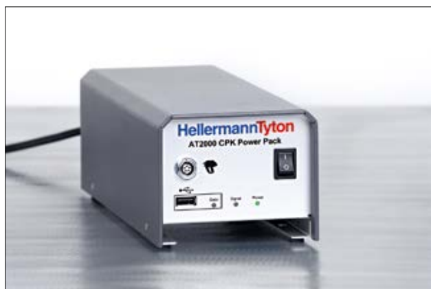
Power Pack for Autotool 2000 CPK.