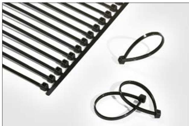
Buntebånd for Autotool system 2000.